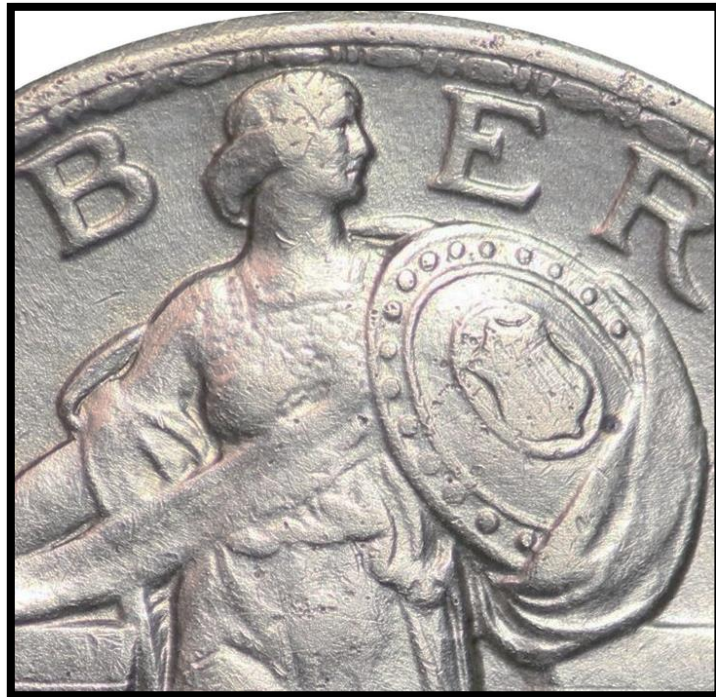
Type B Avec buste habillé.

De nombreuses différences existent entre les deux types.