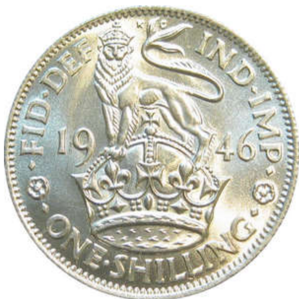
Type A Listel étroit.