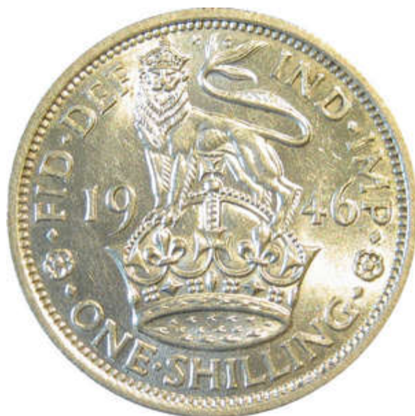
Type B Listel large.