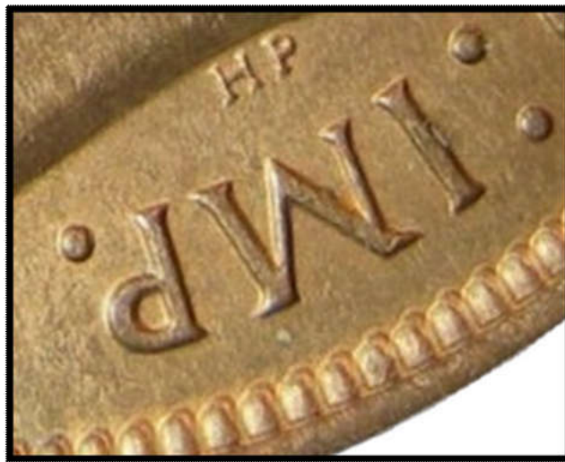
Les deux images superposées.