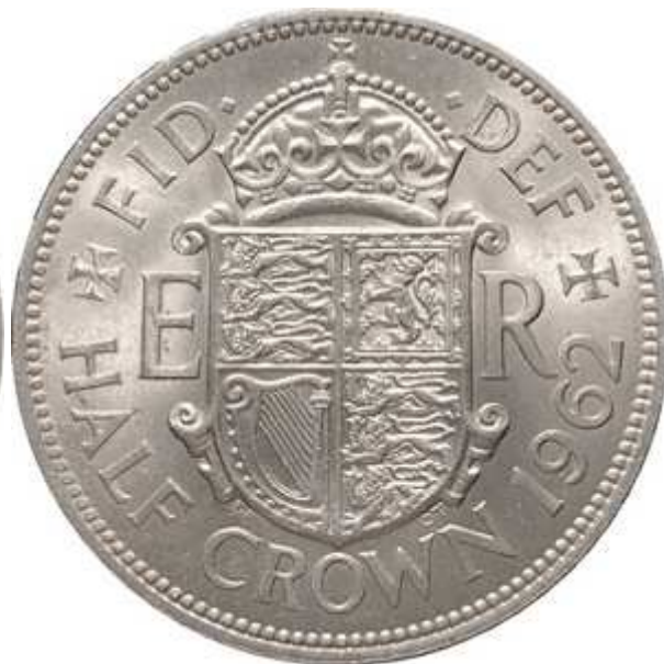
Type 2 1962-1967