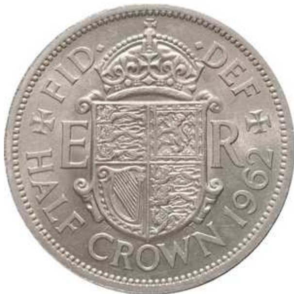
Type 1 1954-1962