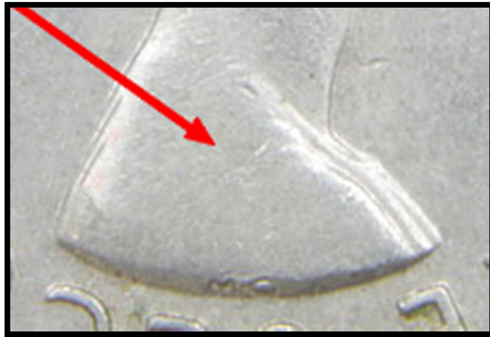
Type A Sans pli sur l'épaule.