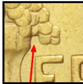
Type B - C