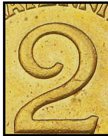
Type B - C