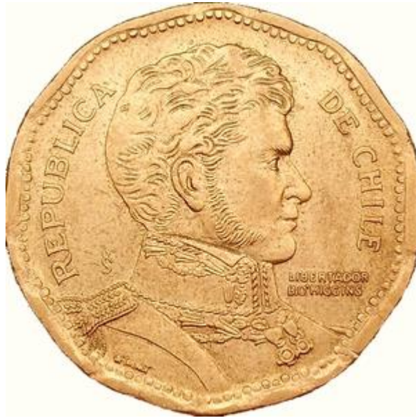
Type A - B