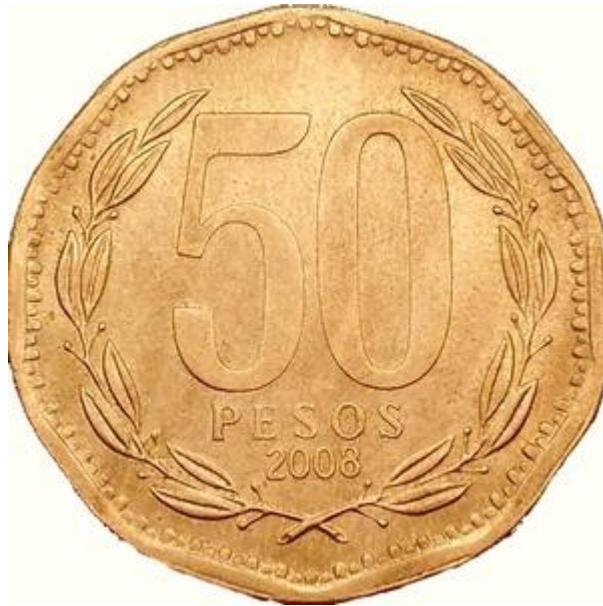
Type A - D