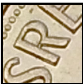
Avers 4 Légende fine avec la boucle du R fermée.