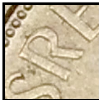
Avers 3 Légende fine avec la boucle du R ouverte.