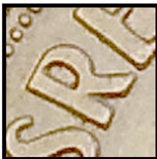
Avers 2 Légende épaisse.